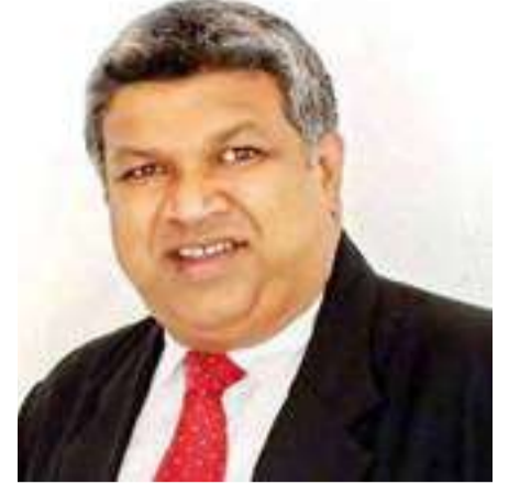
நானயக்கார, இறக்காமம் பிரதேசத்தில் சுற்றுலா நீதிமன்றம் அமைப்பது தொடர்பான கடிதங்களின் பிரதிகளை தமக்கு வழங்குமாறு கேட்டுக்கொண்டதுடன், நீதிசேவை ஆணைக்குழுவுடன் தொடர்புகொண்டு இறக்காமம் பிரதேசத்தில் சுற்றுலா நீதிமன்றம் அமைப்பதற்கான நடவடிக்கைகளை முன்னெடுப்பதாக தெரிவித்தார்.

பெறுமதியான நேரத்தை மொழி பெயர்ப்புக்காக செலவிட வேண்டிய துர்ப்பாக்கிய நிலையும் ஏற்பட்டுள்ளது. எனவே தமிழ் பேசுகின்ற மக்களை கொண்ட இறக்காமம் பிரதேசமானது தமிழ் மொழியை நீதிமன்ற மொழியாக கொண்ட அக்கரைப்பற்று நீதி நிர்வாக வலயத்தின் கீழ் கொண்டு வரப்பட வேண்டும் அல்லது இறக்காமம் பிரதேசத்திற்கான தனியான நீதிமன்றம் அமைப்பதற்கான ஏற்பாடுகளை நீதி அமைச்சர் மேற்கொள்ள வேண்டும் என நான் ஏற்கனவே கோரியுள்ளேன். இதன் மூலம் நீதிமன்ற நடவடிக்கைகள், பொலிஸ் விசாரணைகள் மற்றும் வழக்கு நடவடிக்கைகளை தமிழ் மொழியில் நடத்துவதற்கு இலகுவாக அமையும் என்றும் அவர் மேலும் கூறினார். இதற்கு பதிலளித்த அமைச்சர் ஹர்ஷண