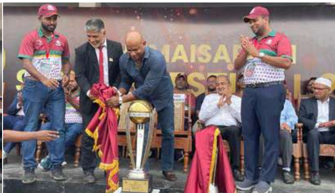
பேருவளை - பீ.எம். முக்தார்

1918 ஆம் ஆண்டு கல்விப் பயணத்தைத் தொடங்கிய பேருவளை - சீனன் கோட்டை அல்ஹுமையஸரா தேசிய பாடசாலை, நூற்றாண்டுக்கும் மேலான கல்விப் பாரம்பரியத்தை தன்னகத்தே தாங்கி நிற்கும் பெருமைமிக்க கல்வி நிலையமாக விளங்குகிறது.