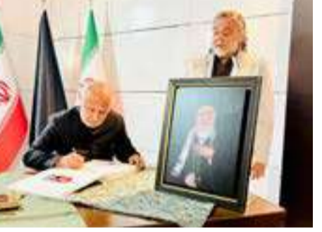
தூதரக அதிகாரிகளும் அவர்களைச் சந்தித்து உரையாடினர்.