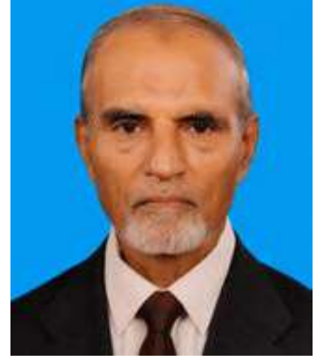
இடங்களில் அஹதிய்யா பாடசாலைகள் இயங்காதுள்ளன மேலும் அன்றைய தினங்களில் தனியார் வகுப்புகள் நடத்தப்படுவதால் அவற்றுக்கு மாணவர்கள் செல்வதும் ஒரு காரணமாகும் எனவே தனியார் வகுப்புகள் நடத்துவோர் அன்றைய தினத்தை மாணவர்களது மத கல்வி நலன்கருதி அவர்களுக்கு அஹதிய்யா போன்ற அறநெறி பாடசாலைகளுக்கு செல்ல வாய்ப்பளிக்குமாறு வேண்டுவதுடன் இதுகுறித்தும் மாணவர்களை நல்வழிப்படுத்த அஹதிய்யாவின் அவசியம் குறித்தும் வணக்கஸ்தலங்களில் அறிவுரைகள் வழங்கலாம் சமூக ஆர்வலர்களும் அதற்கு உதவி புரியலாம் என்றார்.

ஊர்களின் பாடசாலைகள் போன்ற பொருத்தமான இடங்களில் நடாத்தப்பட்டு வருகின்றன அவ்வப்போது அரசு பரீட்சைகள் திணைக்களத்தின் ஏற்பாட்டில் ஆண்டிறுதிப் பரீட்சை , இடைநிலைப் பரீட்சை , மற்றும் தர்மாச்சாரிய பரீட்சை என்பன நடாத்தப்பட்டு வருகின்றன இதில் தர்மாச்சாரிய பரீட்சையின் பெறுபேறுகள் பல்கலைக்கழக அனுமதியின்போதும் வேலை வாய்ப்புகளின்போதும் மேலதிக விசேட தகைமைகளாகக் கொள்ளப்படுவது குறிப்பிடத்தக்கது. எனவே அஹதிய்யா பாடசாலைகளின் முக்கியத்துவத்தை மாணவர்களும் பெற்றோரும் சமூக ஆர்வலர்களும் உணர்ந்து மாணவர்களை அஹதிய்யா கல்வி பெற ஊக்குவிக்கவேண்டும் இச்சந்தர்ப்பத்தில் அஹதிய்யா மாணவர்களது கல்வி நலன்கருதி எமது இலங்கை வானொலி முஸ்லிம் சேவையின் ஏற்பாட்டில் "அறிவுப் பூங்கா" எனும் போட்டி நிகழ்ச்சியையும் இப்பாடசாலைகளின் மாணவர்களுக்கிடையில் நடாத்தி அவர்களுக்கான வானொலி சான்றுகளுடன் ஊக்குவிப்புப் பரிசுகளும் வழங்கி வருகிறோம் இதற்கு ஒத்துழைப்பு நல்கும் அனுசரணையாளர்களுக்கு நன்றி கூற கடமைப்பட்டுள்ளோம். இவ்வாறான நிலையில் பல