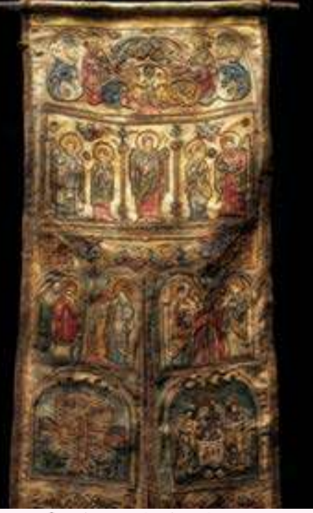
இடைக்கால ஐரோப்பா தேவாலய அப்ளிக் பெயர்

குழந்தைகள் குவில்ட், பேக்கில் 3னு அப்ளிக், ஃபீல்ட் துணி அப்ளிக் ட்ரெண்டாக உள்ளது. லேசர் கட்டிங், கம்ப்யூட்டர் எம்பிராய்டரி வந்த பின் நுணுக்கமான வடிவம் சில நொடியில் வெட்டி தைக்க முடிகிறது. ஆனால் கைவினை அப்ளிக்கிற்கு இன்னும் தனி மதிப்பு உண்டு. "அப்பைக்கிளிங்" மற்றும் "சஸ்டைனபிள் ஃபேஷன்" காலத்தில், பழைய துணியை வெட்டி புது டிசைன் உருவாக்கும் அப்ளிக் மீண்டும் முக்கியத்துவம் பெறுகிறது. வரலாறு முழுக்க அப்ளிக் ஒரு செய்தியை சொல்கிறது: சின்ன துணிகளும் வீணில்லை, அதை சரியான இடத்தில் பொருத்தினால் அது அழகாகும். எகிப்திய கூடாரம் முதல் இன்றைய ரேம்ப் வாக் வரை, அப்ளிக் மனிதனின் படைப்பாற்றலுக்கு சாட்சியாக நிற்கிறது. இது கடந்த காலத்தின் கலை மட்டுமல்ல, எதிர்காலத்தின் சூழல் சார்ந்த தீர்வும் கூட.