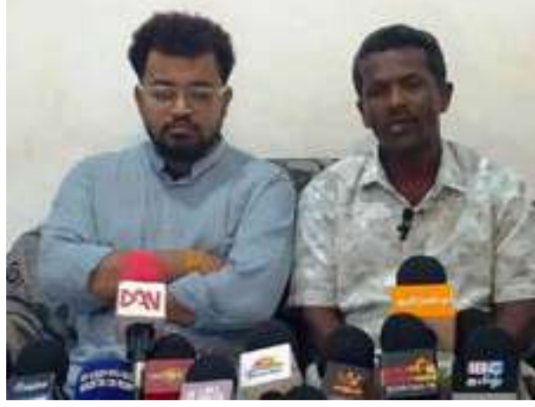
முஸ்லீம் மக்கள் பெரும்பான்மையாகவும் தமிழ் மக்கள் சிறுபான்மையாகவும் வாழுகின்ற இடமாகும். ஆனால் 1989 ஆண்டு முதல் கல்முனை வடக்கு பிரதேச செயலகம் தொடர்பில் யாவரும் அறிவீர்கள். இப்பிரதேச செயலகம் குறித்து எமது தமிழ் தேசிய தலைவர்களும் முஸ்லீம்

மேற்கொண்டு செய்தியாளர்கள் கேட்ட கேள்வி ஒன்றிற்கு பதிலளிக்கும் போது மேற்கண்டவாறு குறிப்பிட்டார். மேலும் தனது கருத்தில் குறிப்பிட்ட தாவது.. அம்பாறை மாவட்டம் மூன்று இனங்கள் வாழும் சமூகமாக இருக்கின்றோம். இந்த நாட்டில் இனரீதியான பிரச்சினைகள் இருந்தாலும் நாங்கள் வாழ வேண்டும் என்பதற்காக நாட்டில் உள்ள இரு இனங்களுடன் இணைந்து வாழ்கின்றோம். இலங்கை தமிழரசுக் கட்சியானது சிறுபான்மை இன விடுதலைக்காக நண்ட காலம் பயணித்த ஒரு கட்சியாகும். இதே வேளை கல்முனை பிரதேசம் சம்பந்தமாக இங்கு கூற வேண்டியது காலத்தின் தேவையாக உள்ளது. கல்முனை பிரதேசம் என்பது