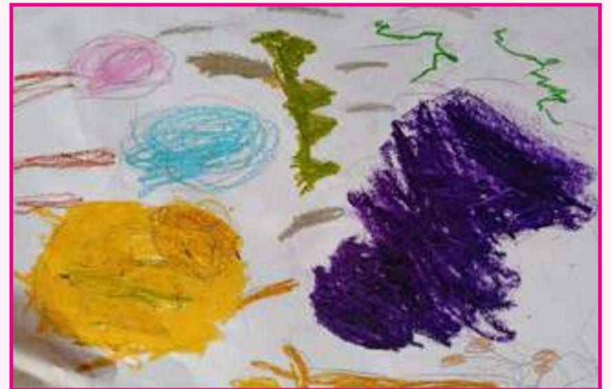
W.HUMAIDH AHAMED LKG 3+ IDEAL CHILDREN 'S HOUSE MAWANELLA

இஸ்ஹா இரஃகூன் தரம் -5 கு/அல் - அக்ஸா ம.வி பொல்கஹாவை