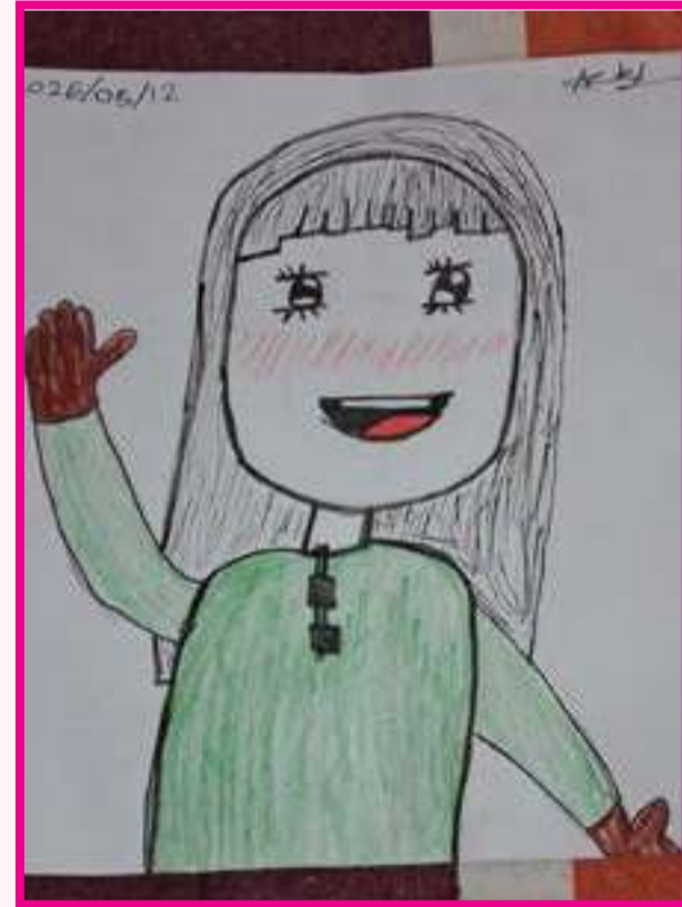
A. A. Azka 11yrs old Badhuriya central college, mawanella.