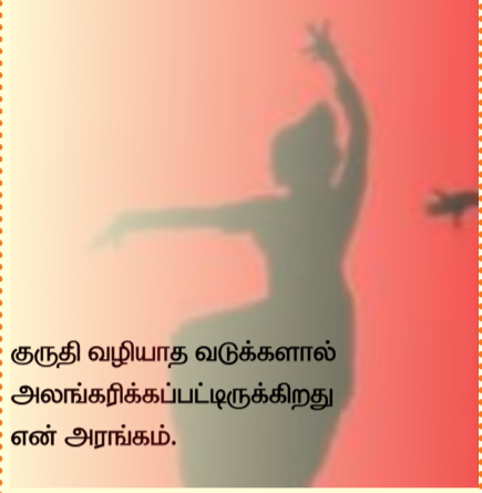
குருதி வழியாத வடுக்களால் அலங்கரிக்கப்பட்டிருக்கிறது என் அரங்கம்.

இங்கு அடிவயிற்றின் ரகசியக் கீறல்களிலிருந்துதான் இசை துவங்குகிறது.