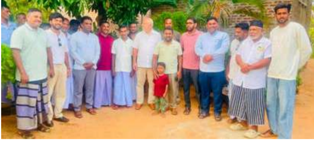
பங்கேற்றார். புத்தளம் மாநகர சபை உறுப்பினரும், ஸ்ரீ லங்கா முஸ்லிம் காங்கிரஸ் புத்தளம்

புத்தளம் கரைத்தீவு, உளுக்காப் பள்ளம், புளுதிவயல், பாலாவி, நாகவில்லு மற்றும் கொத்தாந்தீவு ஆகிய பகுதிகளில் நடைபெற்ற கட்சி முக்கியஸ்த்தர்களுடனான கலந்துரையாடல்களிலும் அவர்