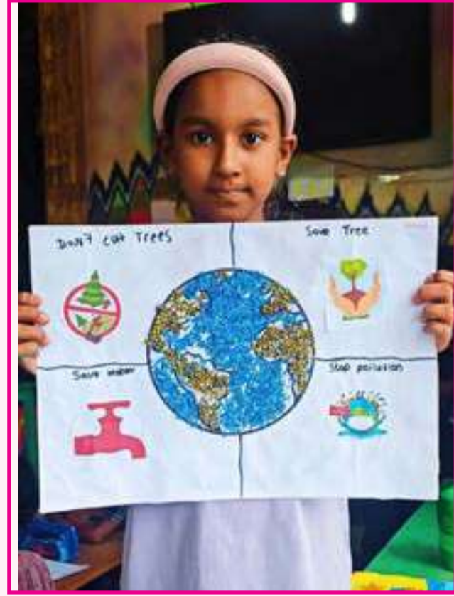
M.I.Amrash Al Hamza International School, Mawanella. Theme - My Dream City