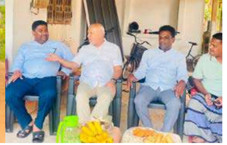
மற்றும் ஆதரவாளர்கள் பெருமளவில் கலந்துகொண்டனர். இந்நிகழ்வின் போது, பிரதேச மக்களின் பிரச்சினைகள்,