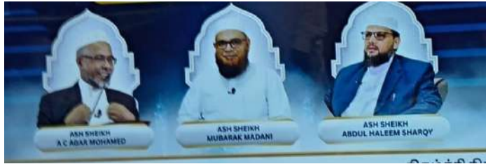
கனடாவின் புறநகரான ஒன்டாரியோவின் மஸ்ஜித்

அல் ஜன்னா இங்கு வாழும் தமிழ் பேசும் முஸ்லிம்களை அறிவுட்டு வதற்காக ஒரு வார கருத்தரங்கினை நடத்தியது. இலங்கை