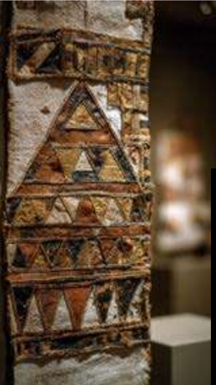
பாரோ மன்னன் தூதர்மோஸ் ஜென்-ன் கூடார துண்டு

விலை உயர்ந்ததால், சின்ன சின்ன துண்டுகளை சிக்கனமாக பயன்படுத்த இந்த அப்ளிக் முறை உதவியது. கி.பி 1893-இல் அமெரிக்கர்கள் ஹவாய் அரசைக் கைப்பற்றினர். அரசி லிலியூஓகலானியை அவரது அரண்மனையின் மேலறையில் எட்டு மாதங்கள் சிறைவைக்கப்பட்டார். இவருக்கு பேசவும், எழுதவும் தடை விதிக்கப்பட்டது.