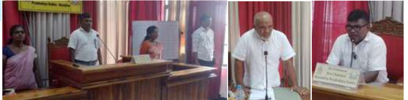
மேலும் மாளிகைக்காடு பிரதேசத்தில் வடிகாண்கள் துப்பராக பேணப்படாமையால் டெங்கு ஆபத்துக்கள் உள்ளது. மக்களை மட்டும் குறை கூறாது நமது பொறுப்புக்களையும் நாம் செய்ய வேண்டும். உடனடியாக மக்களின் பிரச்சினைகளை தீர்க்க சபை முன்வர வேண்டும் என்ற கோரிக்கையையும் முன்வைத்தார். இவற்றுக்கு பதிலளித்த தவிசாளர்