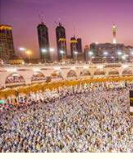
ஈடுபடுவதை இஸ்லாம் ஜிஹாதை விட சிறாந்த வணக்கமாகச் சொல்கின்றது.

ஜிஹாத் என்பது அப்பாவி மக்களைக் கொலை செய்யும் கோலைத் தனமான தற்கொலைத் தாக்குதல் அல்ல. அது தன்மையும், தன் மதத்தையும், தன் நாட்டு மக்களையும் அழிக்கப் படையெடுத்து வரும் எதிரிகளுக்கு எதிராக அரசின் கட்டளைப்படி போர்க் களத்தில் நேருக்கு நேர் அவர்களை எதிர்த்துப் போராடும் இராணுவ நடவடிக்கையே ஜிஹாதாகும். இதையே இஸ்லாம் ஜிஹாத் என்கின்றது. இந்த ஜிஹாதைக் கூட இஸ்லாம் புனிதமாதமாக கூறும் நான்கு மாதங்களில் (துல் கஃதா , துல் ஹிஜ்ஜா, முஹர்ரம், ரஜப்) தடை செய்கின்றது. அதிலும் குறிப்பாக துல் ஹஜ் முதல் பத்து நாட்களில் நன்மையான காரியங்களில்