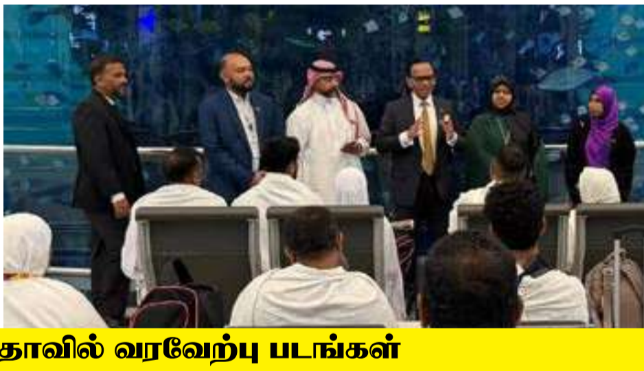
ஜித்தாவில் வரவேற்பு படங்கள்