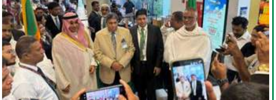
கட்டுநாயக்க வழியனுப்பல் படங்கள்

பயணமாகினர். இவர்களை வழியனுப்பும் நிகழ்வு 01 ஆம் திகதி வெள்ளிக் கிழமை மாலை 05 மணிக்கு பண்டாரநாயக்க சர்வதேச விமான நிலையத்தில் இடம்பெற்றது.