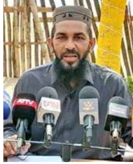
பிரதேசத்தில் வைத்து பொலிஸாரினால் கைது செய்யப்பட்ட பாணந்துறையைச் சேர்ந்த ஏழு முஸ்லிம் இளைஞர்களுக்கும் நீதித்துறை சரியாக செயற்பட்டமையால் 50 ஆயிரம் ரூபாய் சரீர பிணையில் விடுதலை செய்யப்பட்டு

செய்யப்பட்டுள்ளனர். சுற்றுலா செல்லும் எல்லோரும் ஒழுங்கான உணவகங்களை சுற்றுலா தளங்களில் தேடுவது வழமையே. அதற்காக கைது செய்வதென்பது எந்த வகையில் நியாயம்? இனிவரும் காலங்களில் உதிர்ந்து விடும் இஸ்ரேல் நாட்டவர்களின் முடியை முஸ்லிம்கள் மிதித்தால் கூட பாதுகாப்பு தர்ப்பு கைது செய்வார்களோ என்ற சந்தேகம் எழுகிறது. அந்த இளைஞர்களுக்கு உதவிய அவர்களின் குடும்பத்தினரை கூட தீவிரமாக பாதுகாப்பு துறையினர் கண்காணிக்கும் நிலை இருக்கிறது. இஸ்ரேல் நாட்டவர்களினால் நாட்டுக்கு கிடைக்கும் வருமானத்தை விட அவர்களின் பாதுகாப்புக்கே அரசாங்கம் அதிக நிதியை செலவிடவேண்டியிருக்கிறது. பொத்துவில் - அறுகம்ஸை