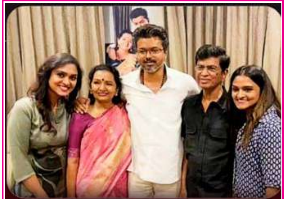
வெற்றிக்குப் பிறகு பெற்றோரை சந்தித்த விஜய்

2. கேரள முதல்வர் பினராயி விஜயன் - வெற்றி கேரள முதல்வர் பினராயி விஜயன் தர்மடம் சட்டப்பேரவைத் தொகுதியில் 85,614 வாக்குகள் பெற்று 19,247 வாக்குகள் வித்தியாசத்தில் வெற்றி பெற்றுள்ளார். முதல்வராக தொடர்ந்து கடந்த 3 தேர்தல்களிலும் பினராயி வென்றுள்ளது. கேரளத்தில் இந்திய கம்யூனிஸ்ட் கட்சி தலைமையிலான ஆட்சியை வீழ்த்தி காங்கிரஸ் ஆட்சியைப் பிடித்துள்ளது.