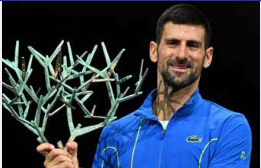
சார்லஸ் அல்காரஸ் மணிக்கட்டு உபாதை காரணமாக நடப்பு ஆண்டிற்கான மெட்ரிட் ஓபன்

மெட்ரிட் ஓபன் சர்வதேச டென்னிஸ் போட்டி வருகிற 22ஆம் திகதி ஸ்பெயினில் ஆரம்பமாகவுள்ள நிலையில் இத் தொடரில் இருந்து முன்னாள் முதல்தர வீரரும், தற்போதைய தரப்படுத்தலில் 4ஆம் நிலை வீரருமான சேர்பியாவின் நோவக் ஜெக்கோவிச் விலகிக் கொண்டுள்ளார். தோள்பட்டை காயத்திலிருந்து இன்னும் முழுமையாக குணமடையாத காரணத்தினால் தான் இத் தொடரிலிருந்து விலகிக் கொள்வதாக ஜெக்கோவிச் அறிவித்துள்ளார். மேலும் நடப்புத் தரப்படுத்தலில் 2ஆம் நிலை வீரரும் முன்னாள் சம்பியனுமான ஸ்பெயினின்