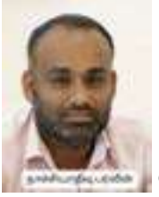
நாச்சியாதீவு பர்வீன் (தேசிய நீர்வழங்கல் வடிவாமைப்பு சபை)