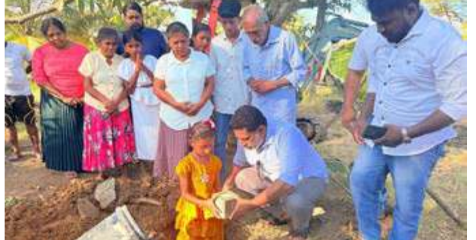
கட்ட காசோலை வழங்கும் நிகழ்வு புத்தளம் பிரதேச செயலக பிரதான மண்டபத்தில், பொது நிர்வாகம், மாகாண சபைகள் மற்றும் உள்ளூர் ராட்சி அமைச்சர் பேராசிரியர் சந்தன அபயரத்தன தலைமையில் கடந்த வாரம் வழங்கப்பட்டமையும் குறிப்பிடத்தக்கது.