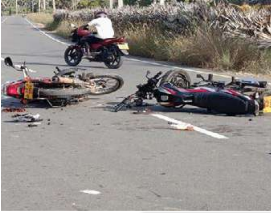
அதிகாரம் இல்லாத சுதந்திரம் - அதுவே கொலைவழி.

மரணம் எங்கேயும் வரலாம்... எப்படியும் வரலாம்... ஆனால், அதை காரணம் காட்டி பொறுப்பின்றி வாழ்வது.. துணிவு அல்ல... அது முட்டாள்தனம்.