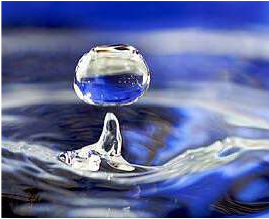
நோய்தடுப்பும் நீரின் மூலமே சாத்தியமாகிறது. உடலில் நீர்ச்சத்து குறையும்போது மனித உடல் இயக்கம் பாதிக்கப்பட்டு நோய்கள் உருவாகின்றன. ஆகவே நீர் மனித வாழ்வின் ஆதாரமாகத் திகழ்கிறது என்பதை யாரும் மறுக்க மாட்டார்கள்.