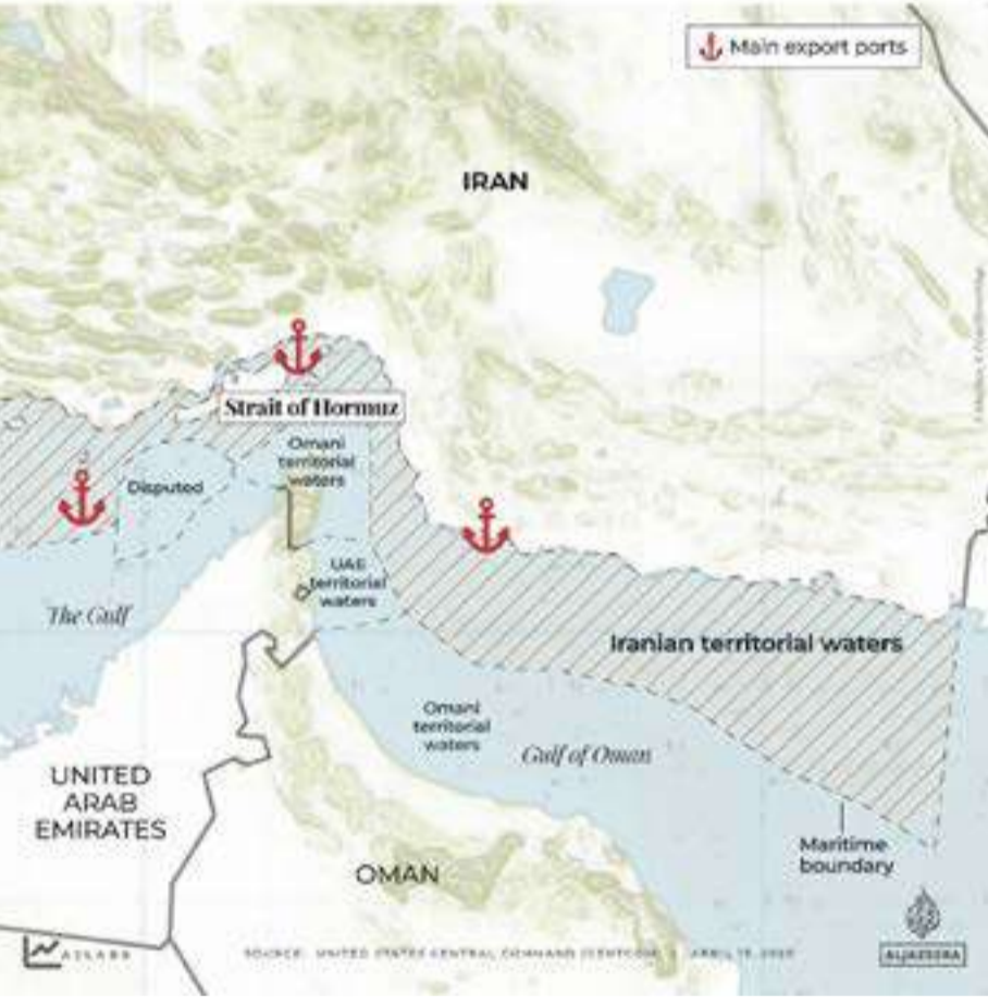
US naval blockade of Iran's ports The United States has announced it will implement a blockade 'against vessels of all nations entering or departing Iranian ports and coastal areas, including all Iranian ports on the Arabian Gulf and Gulf of Oman'.

ஏற்கனவே முதலாம் இரண்டாம் உலகப் போர் காலத்தில் நாடுகளை இராணுவ மற்றும் கடற்படை பலத்தை கொண்டு கைப்பற்றிய சில கொடுங்கோலர்கள், சர்வாதிகாரிகள் பற்றி வரலாற்றில் நாம் அறிந்திருக்கின்றோம். ஹிட்லர், முசோலினி போன்றவர்களுக்கு இந்த வரிசையில் தனியான இடம் இருக்கின்றது. இருபதாம் நூற்றாண்டில் அந்த வரலாற்றை நினைவு தரும் வகையில் அமெரிக்க ஜனாதிபதி ட்ரம்ப்பின் செயற்பாடுகள் நினைவு கூறுகின்றன என்றே கூறலாம். எதிர்வரும் நாட்களில் வளைகுடா நிலைமை மேலும் மோசமடைந்தால் இந்த ஹோமூஸ் கால்வாய் உட்கா நடைபெற்று வரும் சர்வதேச வர்த்தகம் பாதிக்கப்படலாம். அதிலும் ஈரானின் சர்வதேச வர்த்தகத்தை முக்கி அடிபணியச் செய்யலாம் என்பதே ட்ரம்ப்பின் எதிர்பார்ப்பாகும். அதற்கு தலைகுனிந்து ஈரான் இடமளிக்கும் அன்பதே கேள்வியாக இருக்கின்றது. ஏற்கனவே அமெரிக்காவின் திட்டமாக இருந்தது ஈரானின் எண்ணெய் ஏற்றுமதியின் பிரதான தளமாக இருந்து