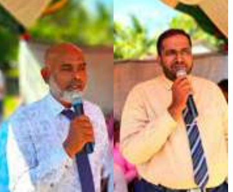
மற்றும் பொதுமக்களும் கலந்து கொண்டனர்.