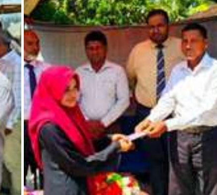
முகாமையாளர்கள், சமுர்த்தி அபிவிருத்தி உத்தியோகத்தர்கள்