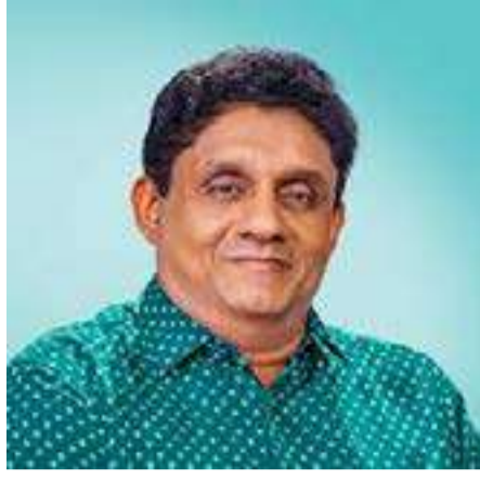
பாரம்பரியத்தின் மரபுரிமையை வழங்கியுள்ளது. இந்த மரபுரிமையை பாதுகாத்து எதிர்காலத்திற்காகப் பேணிக்காத்துச் செல்வது நமது கடமையாகும்.

உதயமாகும் சிங்கள தமிழ் புத்தாண்டு இலங்கையில் வாழும் அனைவருக்கும் அமைதியும் மகிழ்ச்சியும் சுபீட்சம் நிறைந்த புத்தாண்டாக அமையட்டும் என்று உளமார வாழ்த்துகின்றேன். சிங்கள தமிழ் புத்தாண்டு என்பது நம்மிடம் உள்ள மகத்தான கலாசார விழாவாகும். ஒரு கலாசார விழாவின் அடித்தளம் உருவாகுவது அதில் காணப்படும் ஆன்மீக, நெறிமுறை, கலாசார மற்றும் பொழுதுபோக்கு காரணிகளின் அடிப்படையில் ஆகும். சிங்கள தமிழ் புத்தாண்டு இந்த அனைத்து காரணிகளின் வழியாகவும் நமக்கு ஒரு மகத்தான