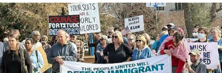
அமெரிக்காவில் ஜனாதிபதி டிரம்புக்கு எதிராகவும் அவரது அரசில் முக்கிய

அமெரிக்க நகரங்களில் வெடித்துள்ள போராட்டம்