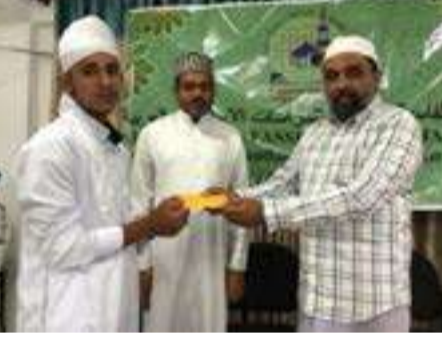
மாணவர்களுக்கும், ஹிப்ழ் பிரிவில் புனித அல்குர்ஆனை மனனம் செய்யும் மாணவர் களுக்கும் இதன் போது பரிசில்களும் வழங்கப்பட்டன. மாணவர்களின் கல்வி நிலை, எதிர்கால திட்டங்கள், பெற்றோர்களின் பங்களிப்பு குறித்து அதிபர் இங்கு தெளிவாக எடுத்துக் கூறினார்.