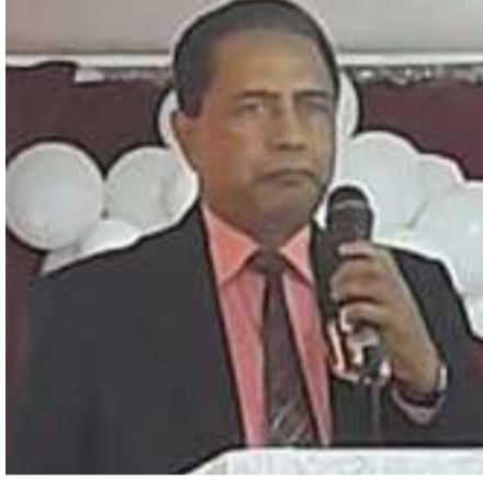
பரிசளிப்பு விழா கடந்த சனிக்கிழமை (18) வித்தியாலயத்தின் பிரதான மண்டபத்தில்