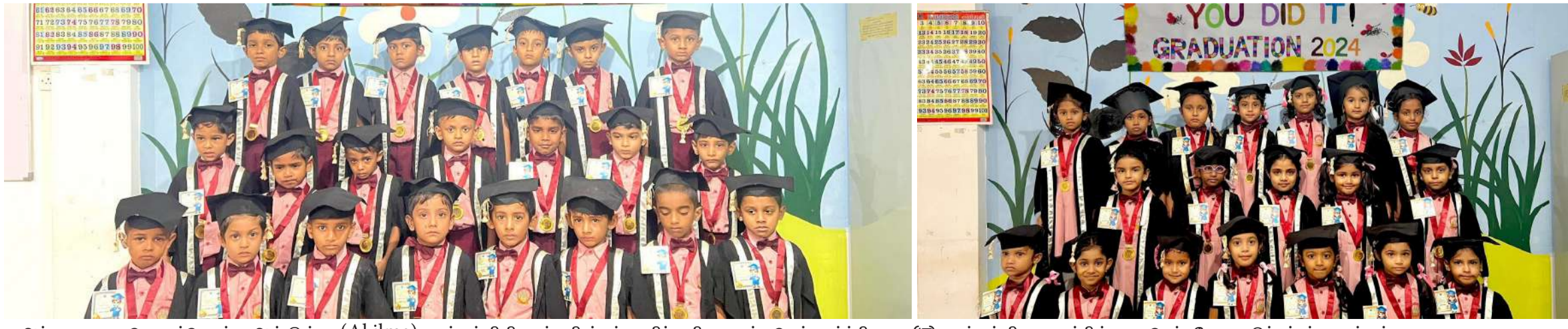
அக்குறணை - தொடன்கொள்ள அல் இல்மா (Al ilma) முன்பள்ளி சிறுவர்களின் பட்டமளிப்பு விழா கடந்த செவ்வாய்க்கிழமை (17) முன்பள்ளி வளாகத்தில் நடைபெற்றபோது எடுக்கப்பட்ட படங்கள்.

பெண்களுக்கு ஜீவனுண்டு, மனம் உண்டு அவர்கள் செத்த மந்திரங்களல்லர், உயிருள்ள செடி கொடிகளைப் போலவும்லர் ஆத்மாவின் எல்லா ஓலங்களும் நிறைந்தவர்கள்தான் அவர்களின் வலியை வேதனையை இப்படியும் சொல்லலாம் என்பதற்கு அனாரின் முதிர்ந்த கவிதைத் தொகுப்பாக “ஜின்னின் இரு தோகை”யை அவதானித்தேன்.