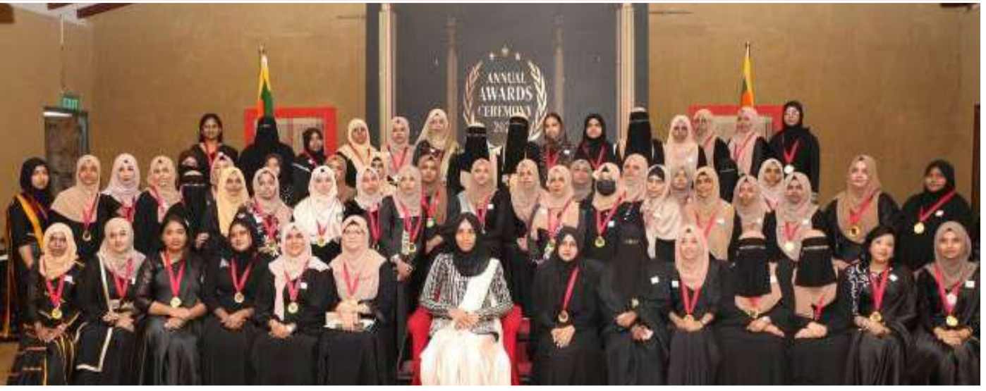
உ ஸ்டூடியோ கல்வி நிறுவனத்தின் ஏற்பாட்டில் தையல் கற்கை நெறியை பூர்த்தி செய்த முதல் மற்றும் இரண்டாம் கட்ட மாணவர்களுக்கான சான்றிதழ் மற்றும் பதக்கம் வழங்கும் நிகழ்வு