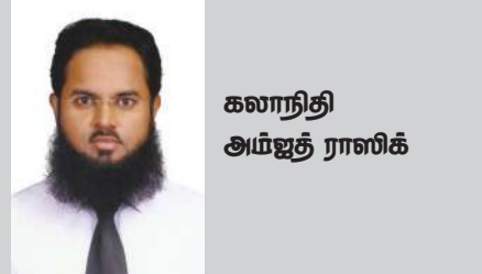
கலாநிதி அம்ஜத் ராஸிக்

தொடர்ந்து பல நாடுகளும் தங்களின் பங்களிப்புகளை அறிவித்தன. உலகளாவிய மட்டத்தில் வசதிபடைத்த நாடுகள் தலையிட்டு இப்படிப்பட்ட இன்னல்களுக்கு உதவிக்கரம் நீட்டுவதன் முக்கியத்துவம் வலியுறுத்தப்பட்ட இவ்வச்சி மாநாட்டில் மொத்தமாக 1.1 பில்லியன் (ஒரு பில்லியன் மற்றும் 100 நூறு மில்லியன்) அமெரிக்க டாலர்கள், (321.2 பில்லியன் இலங்கை ரூபாய்கள்) சவூதி அரேபியாவுடன் கைகோர்த்த நேச நாடுகளின் பங்களிப்புடன் உதவித் தொகையாக ஒன்று சேர்ந்தது இவ்வச்சி மாநாட்டின் பாரிய வெற்றியினைக் குறித்து நிற்பதாக ஆய்வாளர்கள் குறிப்பிடுகின்றனர். சனைக்காது தொடர்ந்தும் மனிதநேயப்பணிகளில் தன்னை ஈடுபடுத்திக்கொள்ளும் சவூதி அரேபியாவின் பணிகளுக்குக் கிடைத்த வெற்றியாகவும் சாதனையாகவும் இம்மாநாட்டினை நோக்கலாம். மேலும் “சாட் ஏரி மற்றும் கரையோர நாடுகளின்” முக்கிய தேவைப்பாடுகளை நிவர்த்தி செய்து அங்கே மனிதம் வாழும் சூழலை ஓரளவாவது பூர்த்தி செய்யும் பயணத்தின் முக்கிய திருப்புமுனையாகவும் இம்மாநாட்டின் வெற்றி இருக்குமென்பதில் ஐயமில்லை.