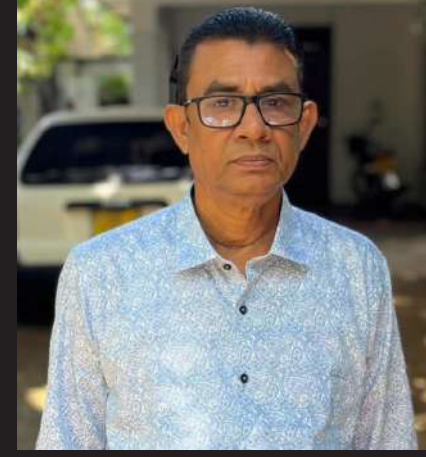
மல்வாணை மத்திய கல்லூரி, கல்முனை சாஹிரா கல்லூரி, பட்டிருப்பு தமிழ் மகா வித்தியாலயம் ஆகியவற்றில் ஆசிரியராக

அவரின் ஜனாஸா நேற்றிரவு 11.00 மணியளவில் மாளிகைக்காடு மஸ்ஜிதுத் தக்வா மஸ்ஜித் மையவாடியில் நல்லடக்கம் செய்யப்படும்.