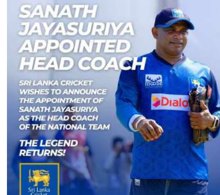
பெறவுள்ள ரி20 உலகக் கிண்ணத் தொடர் வரை இலங்கை ஆடவர் கிரிக்கெட் அணியின் தலைமைப் பயிற்சியாளராக நியமிக்கப்பட்டுள்ளார். இந்த நியமனம் இவருடம் ஒக்டோபர் 1ஆம் திகதி முதல் நடைமுறைக்கு வந்தது, எதிர்வரும் 2026ஆம் ஆண்டு மார்ச் மாதம் 31ஆம் திகதி வரை இருக்கும் என அவ்விழிப்பில் குறிப்பிட்டுள்ளது இலங்கை கிரிக்கெட் சபை என்பது குறிப்பிடத்தக்கது.

இலங்கை கிரிக்கெட் அணியின் தலைமைப் பயிற்றுவிப்பாளராக சனத் ஜெயசூரிய எதிர்வரும் 2026ஆம் ஆண்டு வரை நியமிக்கப்பட்டுள்ளதாக இலங்கை கிரிக்கெட் சபை இன்று உத்தியோகபூர்வமாக அறிவித்துள்ளது. இன்றைய தினம் இலங்கை கிரிக்கெட் சபை வெளியிட்டுள்ள ஊடக அறிவிப்பில் இதனைக் குறிப்பிட்டுள்ளது. அவ்விழிப்பில், இடைக்கால தலைமைப் பயிற்சியாளராக ஜெயசூர்யா பொறுப்பேற்றிருந்த இந்தியா, இங்கிலாந்து மற்றும் நியூசிலாந்துக்கு எதிரான சமீபத்திய சுற்றுப்பயணங்களில் இலங்கை அணியின் சிறப்பான ஆட்டத்தை கருத்தில் கொண்டு இலங்கை கிரிக்கெட் நிர்வாகக் குழு இந்த முடிவை எடுத்துள்ளது. அதற்கமைய சனத் ஜெயசூர்யா 2026ஆம் ஆண்டு இடம்