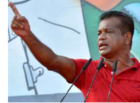
னர் ஏனைய அரசியல் கட்சிகளை பிரதிநிதித்துவப்படுத்தியவர்கள் என பலர் விண்ணப்பித்துள்ளனர். அபேட்சகர்களை தெரிவு செய்யும் நியமனக் குழு இதுவரை 60 பேர் மீது கவனம் செலுத்தியுள்ளது. இந்த 60 பேரில் இறுதியாக 15 பேர் தெரிவு செய்யப்படுவார்கள் என்றும் லால்காந்த தெரிவித்தார்.

(ரஷீத் எம். றியாழ்) பொதுத் தேர்தலில் தேசிய மக்கள் சக்தியின் கீழ் கண்டி மாவட்டத்தில் போட்டியிடுவதற்கு சுமார் 500 பேர் விண்ணப்பித்துள்ளதாக தேசிய மக்கள் சக்தியின் நிறைவேற்றுக் குழு உறுப்பினர் கே.டி. லால்காந்த தெரிவித்தார். கண்டி மாவட்டத்திற்கு 12 உறுப்பினர்கள் பாராளுமன்றத்துக்கு தெரிவு செய்யப்பட வேண்டும். வேட்பு மனுவில் 15 உறுப்பினர் களின் பெயர்கள் இடம் பெற்றிருக்க வேண்டும் என்ற நிலையில் சுமார் 500 பேர் எம்மிடம் விண்ணப்பித்துள்ளனர். பொதுத் தேர்தலில் போட்டியிடும் ஆர்வத்தில் கல்விமான்கள், வர்த்தகர்கள் மற்றும் இதற்கு முன்-