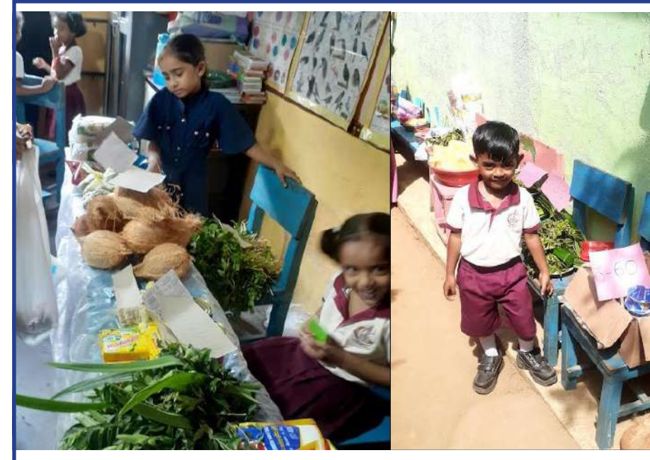
உலக சிறுவர்கள் தினத்தையொட்டி உக்குவளை மாருகொன பாத்திமா பாலர் பாடசாலையில் சிறுவர்களது சந்தை வியாபாரம் இடம்பெற்றதை படத்தில் காணலாம்.