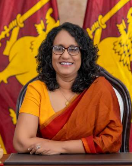
பதவியை அடைந்துள்ள ஹரிணியின் பயணத்தை கண்டு அவரது ஆசிரியர்கள் பெருமை கொள்கிறார்கள் எனக் குறிப்பிடப்பட்டுள்ளது.