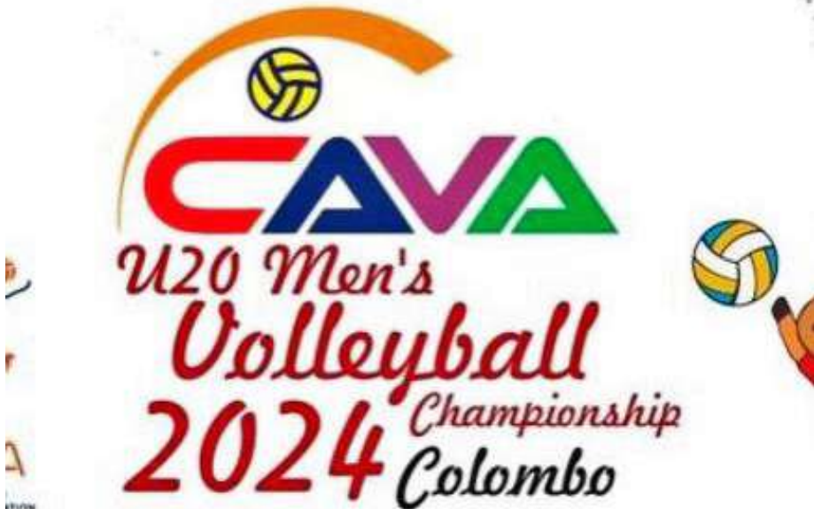
20 வயதுக்குட்பட்ட ஆண்களுக்கான மத்திய ஆசிய

கரப்பந்தாட்ட சம்மேளனமும் இணைந்து ஏற்பாடு செய்துள்ள