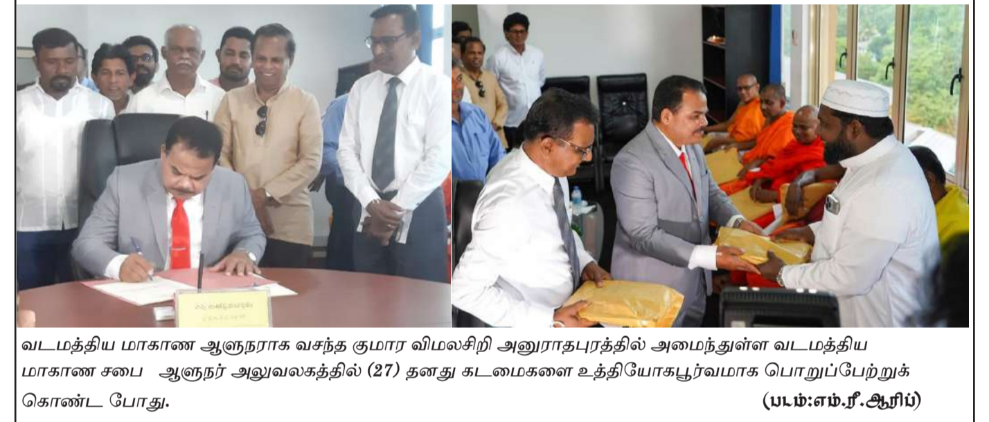
வடமத்திய மாகாண ஆளுநராக வசந்த குமார விமலசிறி அனுராதபுரத்தில் அமைந்துள்ள வடமத்திய மாகாண சபை ஆளுநர் அலுவலகத்தில் (27) தனது கடமைகளை உத்தியோகபூர்வமாக பொறுப்பேற்றுக் கொண்ட போது.