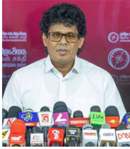
கொண்டாடத் தயாராகுவோம்” என்றார்.

தற்போது எமது அமைச்சர்களுக்கு 8 வீதம் கமிஷன் இல்லை. இதனால் முட்டை விலை தானாக 8 வருடப்பின்னால் குறைந்துள்ளது. எதிர்காலத்தில், அத்தியாவசியப் பொருட்களின் விலைகளும் மேலும் குறைவடையும். இதனால், 2025 இல் மகிழ்ச்சியாக வாழ முடியும். அடுத்த மாதம் இடம்பெறும் பொதுத் தேர்தலில் நாம் 2/3 பெரும்பான்மையில் வெற்றி பெற்று ஆட்சி அமைத்து, அடுத்த வருடம் ஏப்ரல் மாதம் 76 வருடங்கள் இல்லாத அளவு ஒரு புத்தாண்டைக்