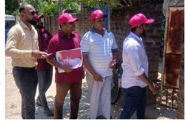
செயற்பாட்டாளர்களால் முன்னெடுக்கப்பட்டு வருகின்றது.

(இலட்சுமி. லக்ஷ்மான்) தேசிய மக்கள் சக்தியின் ஜனாதிபதி வேட்பாளர் அனுர குமார திசாநாயக்கவின் வெற்றியை உறுதி செய்யும் வகையில் ஒலுவில் பிரதேசத்தில் வீடுவாசச் சென்று மக்களை தெளிவூட்டும் செயற்பாடுகள் தேசிய மக்கள் சக்தியின் செயற்பாட்டாளர்களால் முன்னெடுக்கப்பட்டு வருகின்றது.