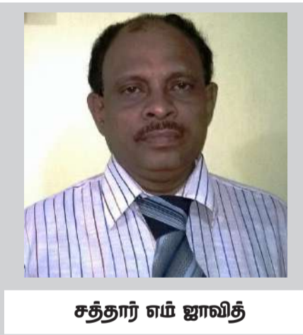
சத்தார் எம் ஜாவித்