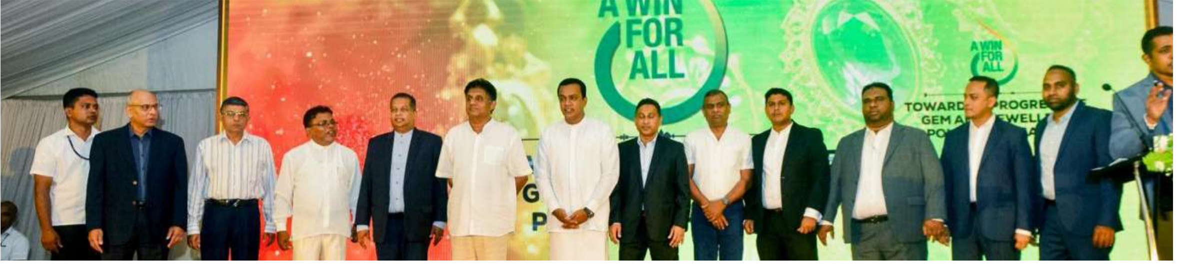
இரத்தினபுரி மாவட்ட பாராளுமன்ற உறுப்பினர் வருண வியனகே மற்றும் குருநாகல் மாவட்ட பாராளுமன்ற உறுப்பினர் ஜே.சி.அலவத்துவல ஆகியோரின் ஏற்பாட்டில் ஐய்கிய மக்கள் சக்தியின் இரத்தினக்கற்கள் மற்றும் ஆபரண மாநாடு பத்தரமுல்லையில் உள்ள Cinnamon Lakeside இல் நடைபெற்றது. இந்த நிகழ்வில் இரத்தினக்கல் மற்றும் ஆபரணத் துறையின் முக்கியஸ்தர்களும் எதிர்க்கட்சித் தலைவர் சஜித் பிரேமதாசவும் கலந்துகொண்டனர். இரத்தினக்கல் மற்றும் ஆபரண தொழிற்சாலைகளின் இயங்கும் இரத்தினபுரி கொழும்பு மற்றும் பேருவளை இரத்தினக்கல் சங்கத்தின் உறுப்பினர்கள் அனைவரும் ஐய்கிய மக்கள் சக்தியின் ஜனாதிபதி வேட்பாளர் சஜித் பிரேமதாசவுடன் கைகோர்த்து இரத்தினக்கல் மற்றும் ஆபரணத்துறையின் முன்னேற்றத்திற்காக பல தீர்மானங்களை எட்டுவதில் இணக்கம் கண்டனர்.