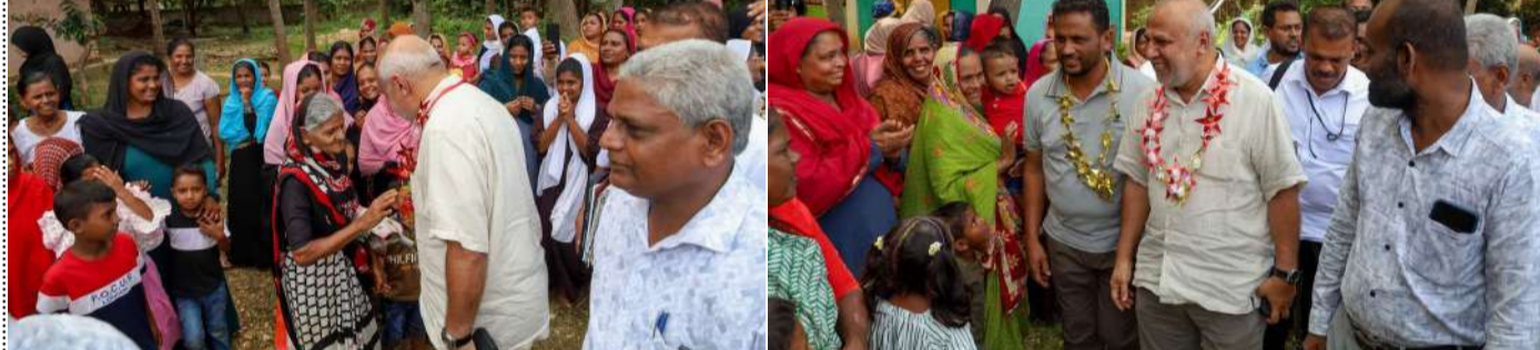
எதிர்வரும் ஜனாதிபதி தேர்தல் பிரசார நடவடிக்கைகள் உக்கிரமடைந்துள்ள நிலையில் ஜனாதிபதி வேட்பாளர் சஜித் பிரேமதாசவை ஆதரித்து ஸ்ரீலங்கா முஸ்லிம் காங்கிரஸ் தலைவர் ரஷூப் ஹக்கீம் அனூராதபுரம் கலென்பிந்துனுவெவ மற்றும் கோமரங்கடவள பகுதிகளுக்கு (11) விஜயம் செய்து பெண்களை சந்தித்து உரையாடிய போது

சென்றுவிட்டனர். முன்னாள் உறுப்பினர்கள் என்ற கௌரவம் இவர்களுக்கு எப்படிக்கிடைத்தது. எமது தாய்மார்கள் வழங்கிய வாக்குகளால் உள்நூராட்சி மன்றங்களுக்கு சென்றாலே, இந்த கௌரவங்கள் இவர்களுக்கு கிடைத்தன. பணத்துக்காக விலைபோனதால், முசலி சமூகத்தின் கௌரவத்தை மலிப்படுத்திவிட்டனர். ஆகையால், விலைபோவார்களுடன் நாங்கள் இல்லை என்பதை இவர்களுக்கு உணர்த்த வேண்டும். எனவே டெலிபோன் சின்னத்துக்கு வாக்களித்து, சஜித் பிரேமதாசவின் வெற்றியில் பங்காளர்களாவோம்” என்றார்.