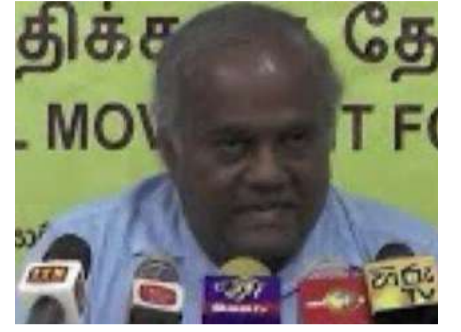
உள்ளதா? என கேட்க விரும்புகின்றேன்” என்றும் ஜே.வி.பி. யின் வங்கிக் கணக்கில் 800 கோடி ரூபா பணம் உள்ளது. இதிலிருந்து ஒரு பாடசாலை பிள்ளைகாவது அப்பியாசக் கொப்பி வாங்கிக் கொடுத்திருப்பார்களா?” என்றும் குற்றம் சுமத்திப் பேசினார்.