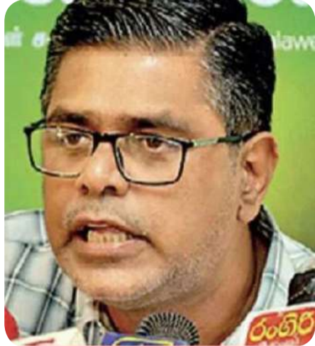
ராஜபக்ஷாக்களை ஆட்சிக்குக் கொண்டு வர, நான் கைகளில் மை பூசிக்கொள்ளவில்லை. அநுரவே அத்திருடர்களை ஆட்சிக்குக் கொண்டு வர அவரது கைகளிலேயே மை பூசிக்கொண்ட தலைவராவார்” என்று கூட்டிக் காட்டினார்.

ஹம்பாந்தோட்டை” கேலில் மஹிந்த ஊழல் செய்தமை தெரிந்தும், 2005 இல் அவரோடு கூட்டு அமைக்கும் போது, அநுரவுக்கு அது ஹராம் என விளங்கவில்லையா? என நான் அவரிடம் கேட்கின்றேன். 1995 இல் சந்திரிக்காவோடு “டீல்” வைத்த அவர், “மஹிந்த ஊழல்வாதி” எனத் தெரிந்திருந்தும் கூட, 2005 இல் அவரை வெற்றிபெறச் செய்து பிரசாரம் செய்தார். மஹிந்தயை “துட்டு கெழுனு அரசன்” என்று கூறியவரும் இந்த அநுர குமார திலாநாயக்க என்பதையும் நினைவு படுத்த விரும்புகின்றேன். அநுரவிடம் உள்ள “ஊழல் பைல்கள்” அனைத்துமே, ராஜபக்ஷ குடும்பத்தினரதும், அவரது கட்சிக்காரர்களுடையதே.