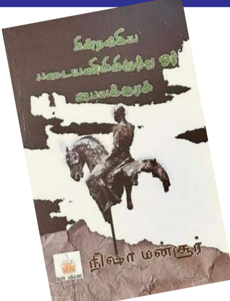
தொலைக்கிறோம் அல்லது மீட்டெடுக்கிறோம்' இச்சமூகத்தின் மீது எவ்வளவு அவநம்பிக்கையுடன் இருந்தாலும், நம்பிக்கையையும் விதைக்கிறார் கவிஞர்: 'அப்படியொன்றும் மோசமில்லாத ஒரு தேநீர்

விரிந்து கொண்டே செல்லும் நகரத்தில் மூச்சுத் திணற வசிக் கவிஞரின் ஆற்றாமை, திடுக்கென்று அதிர்வலைகள் படிப்பவர்கள் மனதில்: 'பள்ளிகளில் வண்புணர்வு செய்யப்படும் சிறுமிகளின் கூக்குரல்கள் விண்ணைப் பிளக்கும் வளர்ச்சி கோஷங்களில் அமுங்கி மறைகின்றன அடையாளமற்று' டு மலரும் தருணத்தில் கவிதையில் நிகழ்கால வாழ்வின் கொடுமையை விவரிக்கிறது: 'எங்கோ ஒரு புதினமவயதுச் சிறுமி தன் வயிற்றுச் சிசுவைச் சுரண்டியெடுத்து குப்பையிலிட்டுக் கடந்துபோகிறார்'. பெருநகரத்தின் நவீன வாழ்வில் இது சகஜமான ஒன்றாக இருக்கக் கூடும். ஆனால் படிக்கும் நமக்கு மிகப்பெரிய அதிர்வைக் கடத்துகிறது. நமது கலாச்சாரம் எங்கே செல்கிறது என்பதற்கு ஒரு எடுத்துக்காட்டாகவும் இருக்கிறது. காதல் கவிதைகளில் இவ்வா அவர் என்னுமளவிற்கு சிறப்பான வரிகளுடனான கவிதைகள்: 'எந்நேரமும் நினைவுவைத்து