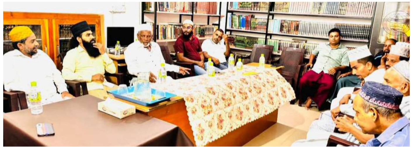
(எஸ்.எம்.எம்.றம்ஸான்) கல்முனை ஜாமிஆ மன்பயில் ஹிதாயா அறுபுக்கலாபீட நிர்வாகிகள் மற்றும் பழைய மாணவர் சங்கத்தின் பிரதிநிதிகளுடனான சந்திப்பு கலாபீட காரியாலயத்தில் இடம்பெற்றது. இந்நிகழ்வில் கல்முனை முஹ்யித்தீன் ஜூம்ஆ பெரிய

பள்ளிவாசல் மற்றும் கடற்கரை பள்ளிவாசல் நாஹூர் ஆண்டகை தர்கா ஷரீப் நிர்வாகிகள் பலரும் கலந்துகொண்டதோடு, ஜாமிஆவின் கடந்தகால சேவைகள், தியாகங்கள், அர்ப்பணிப்புகள் நன்றியுடன் நினைவு கூறப்பட்டதோடு எதிர்காலத்தில் ஜாமிஆவின் பணிகளும் பங்களிப்புகளும் கல்முனை மண்ணிற்கான