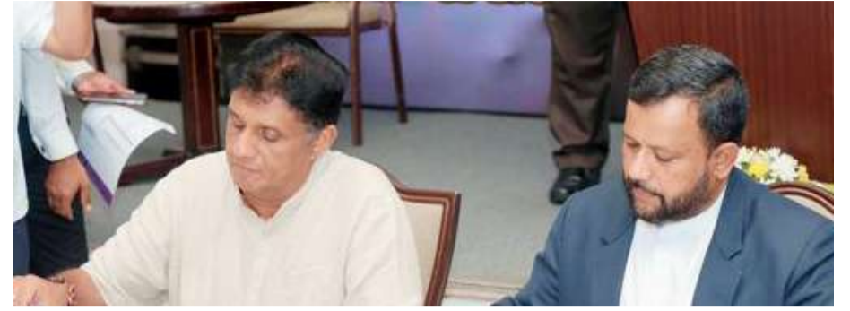
எதிர்க்கட்சித் தலைவராகச் செயற்படும் சஜித் பிரேமதாச, தனது சொந்த தொகுதிக்கு மட்டுமின்றி முழு நாட்டுக்குமே உதவி செய்கிறார். மாணவர்களின் கல்வி முன்னேற்றத்தில் துரநோக்கோடு செயற்படும் இவர், நானூறு

இரகசிய வாக்கெடுப்பு நடைபெற்றபோது கலந்துகொண்ட 47 பேரில், 31 பேர் சஜித்தை ஆதரித்தனர். நாடு பூராகவும் சென்று மக்களிடம் கருத்துக்கேட்போது, கட்சியின் உயர்பீடத்தின் முடிவுக்குக் கட்டுப்படுவதாக தெரிவித்தனர். இதனால்தான், சஜித் பிரேமதாசவை ஆதரிக்கிறோம். இனவாதமில்லாத, வாக்குறுதிகளைக் காப்பாற்றும் நேர்மையான அரசியல்வாதி சஜித், அவருக்கு வழங்கப்படும் சன்மானங்களை மக்களுக்கே அன்பளிக்கும் உயரிய சிந்தனையாளர்.