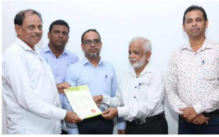
(எஸ்.எம்.ஜாவித்) ஸ்ரீலங்கா முஸ்லிம் மீடியா போர்டின் 2024/25 ஆம் ஆண்டுகளுக்காக தெரிவு செய்யப்பட்ட புதிய நிறைவேற்று குழுவினருக்கும் புதிதாக தெரிவு செய்யப்பட்ட ஆலோசகர்கள்மற்றும் மாவட்ட