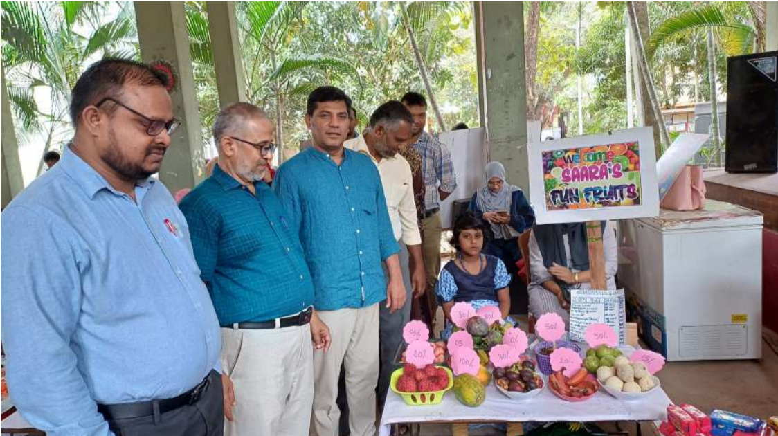
(எம். எம். நியாஸ்) மாணவர் சந்தை நிகழ்ச்சி அட்டாளச்சேனை அல் முனீரா பெண்கள் உயர் பாடசாலையில் நடைபெற்றது. ஆரம்பப் பிரிவு வலயத்