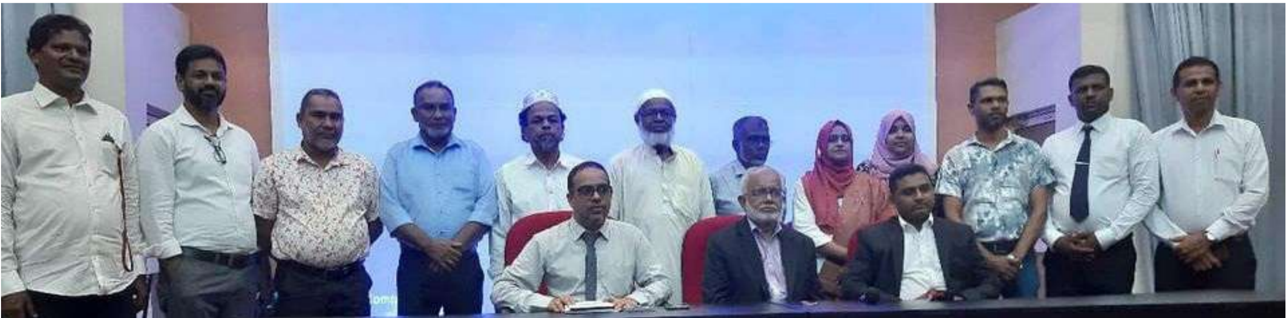
ஸ்ரீ லங்கா முஸ்லிம் மீடியா போர்ட்டின் 2024 / 2025 நடப்பாண்டுக்காகக் கௌரவிக்கப்பட்ட தெரிவாகிய புதிய நிர்வாக சபை