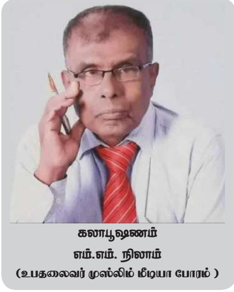
கணபூஷணம் எம். எம். நிலாம் (உபகலைவர் முஸ்லிம் மீடியா போரம்)

34 பேரும் அன்று செயற்குழு உறுப்பினர்களாக இணைக்கப்பட்டமை இங்கு குறிப்பிடப்பட்டதாகும். தேசிய நீரோட்டத்தில் முஸ்லிம் சமுதாயத்தின் எதிர்காலம் குறித்து சிந்தித்து முஸ்லிம் மீடியா போரத்தை தனியான ஊடக இயக்கமாக அமைத்துக் கொண்டோம். தேசிய மற்றும் தனியார் ஊடகங்களில் உள்ளக ஊடகவியலாளர்களாகவும், பிராந்திய செய்தியாளர்களாகவும்,