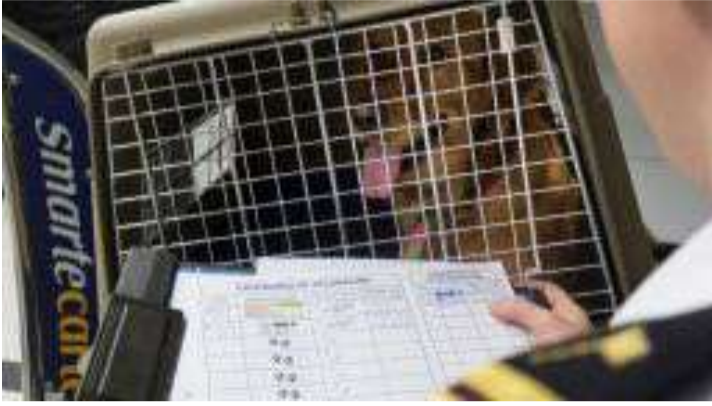
பறவைக் காய்ச்சல் பதிவாகியுள்ள எந்துவொரு நாட்டிலிருந்தும் விலங்குகள் அல்லது விலங்கினப் பொருட்களை இறக்குமதி செய்வதற்கு அனுமதியில்லை என கால்நடை உற்பத்தி மற்றும் சுகாதாரத் திணைக்களம் தெரிவித்துள்ளது.

பொருட்களை இலங்கைக்கு இறக்குமதி செய்வதற்கு அனுமதியில்லை என கால்நடை உற்பத்தி மற்றும் சுகாதாரத் திணைக்களம் தெரிவித்துள்ளது.