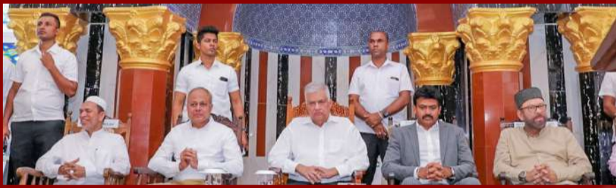
(பலஸ்தீன் ஜனாதிபதி) காலா விவகாரத்தில் இலங்கையின் நிலைப்பாடு ஒருபோதும் மாறாது. பாலஸ்தீன் அரசு 5 வருடங்களுக்குள் நிறுவப்படும்

பலஸ்தீன் அரசு உருவாக்கப்பட வேண்டும் காத்தான்குடி அல் அக்ஸா நிகழ்வில் ஜனாதிபதி கருத்து