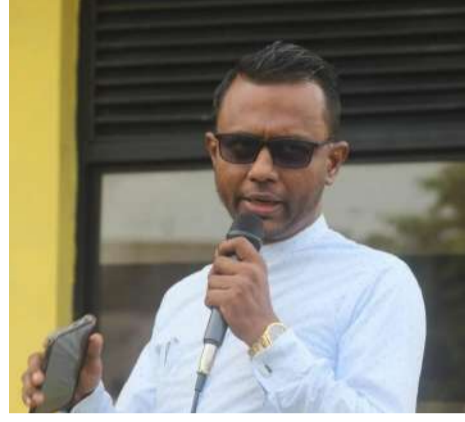
உறுப்பினர்களான விமல் வீரவன்ச மற்றும் உதய கம்மன்பில போன்ற கருப்போக்கு சிந்தனை கொண்டவர்கள் ஜனாஸாக்களை அடக்கம் செய்வதற்கு ஆதரவாக நின்ற போது அதே அரசாங்கத்தின் மற்றுமொரு தரப்பு எதிர்த்தாக பாராளுமன்ற உறுப்பினர்களான வெளிவிவகார அமைச்சர் அலி சபரி மற்றும் விமல் வீரவன்ச

தொடர்பாக முடிவெடுத்த குழு தொடர்பாக பக்கச்சார்பற்ற விசாரணை நடத்தவும், பாதிக்கப்பட்ட இலங்கை வாழ் முஸ்லிம் சமூகத்தின் மனங்களை சாந்தப்படுத்தவும் ஜனாதிபதி ஆணைக்குழுவை அடுத்த ஜனாதிபதி தேர்தலுக்கு முன்னர் உடனடியாக நியமிக்க வேண்டும், தகனம் மூலம், அநியாய சம்பவத்தை செய்த குழுவுக்கு எதிராக சட்டத்தை அமுல்படுத்த வேண்டும் என முஸ்லிம் சமூகத்தின் சார்பில் இந்த சந்தர்ப்பத்தில் ஜனாதிபதியை கேட்டுக்கொள்கிறேன். பூகோள அரசியல் சதிக்காக உடல்களை தகனம் செய்ய முடியும் என்ற முடிவை ஒரு சிறு குழுவின் எடுத்தார்கள் என்றால் அவர்களின் பின்னால் கண்ணுக்குத் தெரியாத சக்தி இருக்கிறதா என்று கண்டுபிடிப்பது நாட்டுக்கு நல்லது. ஏனெனில் நாடாளுமன்ற