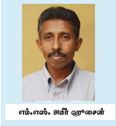
எம்.எஸ். எஸ். அனாண்ட்

வருடங்களுக்கு அதே ஆட்சியை தக்கவைத்துக் கொள்ள முடிந்திருக்கின்றது.