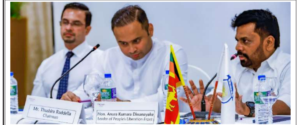
கொழும்பு சின்னமன் லேக் ஹோட்டலில் இடம்பெற்ற இலங்கை இளம் தொழில்முனைவோர் பேரவையின் 2024 ஜூன் மகா சபை கூட்டம் அண்மையில் (06) இடம்பெற்றது. இதில் தேசிய மக்கள் சக்தியின் தலைவர் அநுர குமார திசாநாயக்க கலந்துகொண்டார்.

மேம்படுத்தலுக்காக இவ்வமைச்சிற்கு பொறுப்பளிக்கப்பட்டுள்ள செயற்பணிகளை ஒருங்கிணைத்தல் ஆகியன இப்பதவியின் பிரதான இலக்கு மற்றும் செயற்பணிகளாகும் என்றும் நியமனக் கடித்தத்தில் குறிப்பிடப்பட்டுள்ளது. மேலே தெரிவு செய்யப்பட்ட சர்வமத தலைவர்கள் இலங்கையிலும் சர்வதேச ரீதியிலும் இன ஒற்றுமைக்காக பல்வேறு செயல்பாடுகளை 20 வருடங்களுக்கு மேலாக முன்னெடுத்து வருகின்றமை குறிப்பிடத்தக்கது.