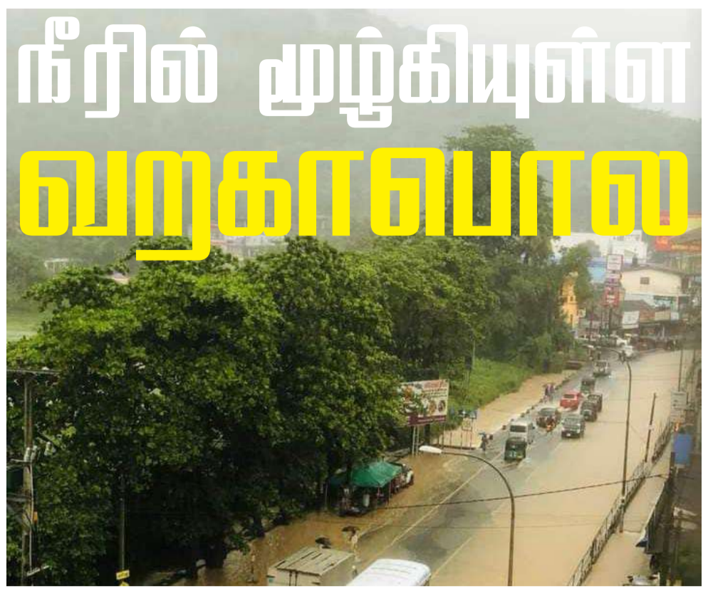
தற்போது நிலவும்.சீரற்ற காலநிலை காரணமாக வரகாபொலை பிரதேசம் வழமைக்கு மாறாக பாதிக்கப்பட்டுள்ளது. அதற்கமைய, ஹஸன்புர, மஸ்ஜித் மாவத்த பகுதிகளில் ஆறு பெருக்கெடுத்துள்ளது. ஹஸன்புர நகரில் முற்றாக பாதைகள் நீரினால் மூடப்பட்டுள்ளது. அதனைத்தொடர்ந்து கொழும்பு பிரதான வீதி வரகாபொலை பிரதேசத்தில் இருந்து முற்றாக தடைப்பட்டுள்ளது. தங்கோவிட பிரதேசத்தில் மரமொன்று முறிந்து வீழ்ந்தமையினால், வீதி தடைப்பட்டுள்ளது. வரகாபொலை பஸ் தரிப்பிடங்களும் நீரினால், மூழ்கியுள்ளது.