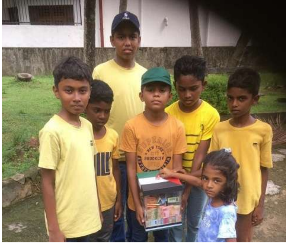
ஆகிய பகுதிகளைச் சேர்ந்த இளம் சிறார் குழுவொன்று 20%4%2024 காலை முதல் பிற்பகல் வரை பிரதேசத்தில் உள்ள வீடுகளுக்கு சென்று காஸா சிறார்கள்ளுக்கான நிதி சேகரிப்பில் ஈடுபட்டனர்.

அதே வேலை சீனன்கோட்டை பெரோரா வீதி மற்றும் நவ்பல் ஜாபிர் மாவத்தை