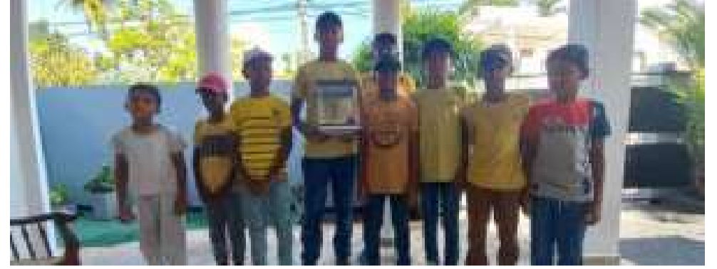
புனித ரமழான் பெருநாள் தினத்தில் தனக்கு அன்பளிப்பாக கிடைத்த நிதியை சிறார்கள் தியாக உணர்வோடு இந்த நிதி சேகரித்த சிறார்களிடம் ஒப்படைத்தனர்.

பிரதேச வாழ் மக்கள் மிக உற்சாகத்தோடு தம்மால் முடிந்த நிதியை ஒப்படைத்தமை இங்கு குறிப்பிடத்தக்கது. இந்த சிறுவர் குழுவினரால் சேகரிக்கப்படும் நிதித் தொகை சீனன்கோட்டை பள்ளிச் சங்கத்திடம் ஒப்படைக்கப்பட உள்ளது. இந்த சிறுவர்களின் துணிச்சல் மிகு செயலை அனைவரும் பாராட்டியதோடு பிரதேச சிறுவர்கள் மற்றும் பாடசாலை மாணவர்கள் மிக ஆர்வத்துடன் நிதி உதவி வழங்கி அவர்களை உற்சாகப்படுத்தினர். சீனன்கோட்டை வாழ் மக்கள் சுனாமி, வெள்ளம், மண்சரிவு, சூராவழி போன்ற இயற்கை அனர்த்தங்களின் போதும் கொரோனா நோய் மற்றும் வன் செயலினால் பாதிக்கப்பட்டோருக்கும் அவ்வப்போது இன, மத, மொழி,