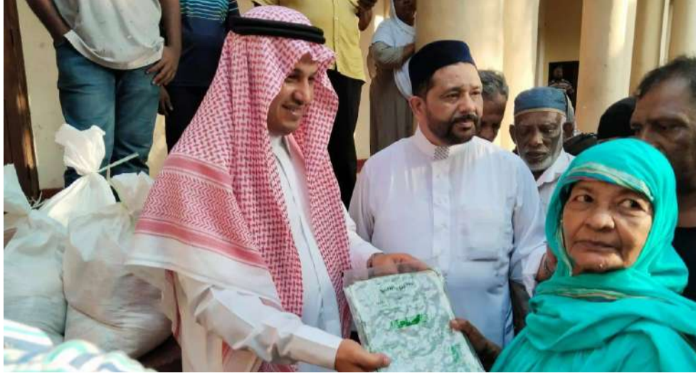
(அலுவல் ச.சமத்) முன்னாள் ஆளுநர் அசாத் சாலி