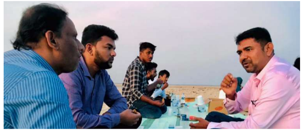
(நூலுள் ஹூதா உமர்)

இலங்கை தென்கிழக்கு பல்கலைக்கழக கலை கலாசார பீட புவியியல் துறை மாணவர்கள் ஏற்பாடு செய்திருந்த புனித ரமழான் இயக்குநர் நிகழ்வு (28) பல்கலையின் கடற்கரை மணலில் இடம்பெற்றது. கலை கலாசார பீட புவியியல் துறை பல்வின மாணவர்கள்