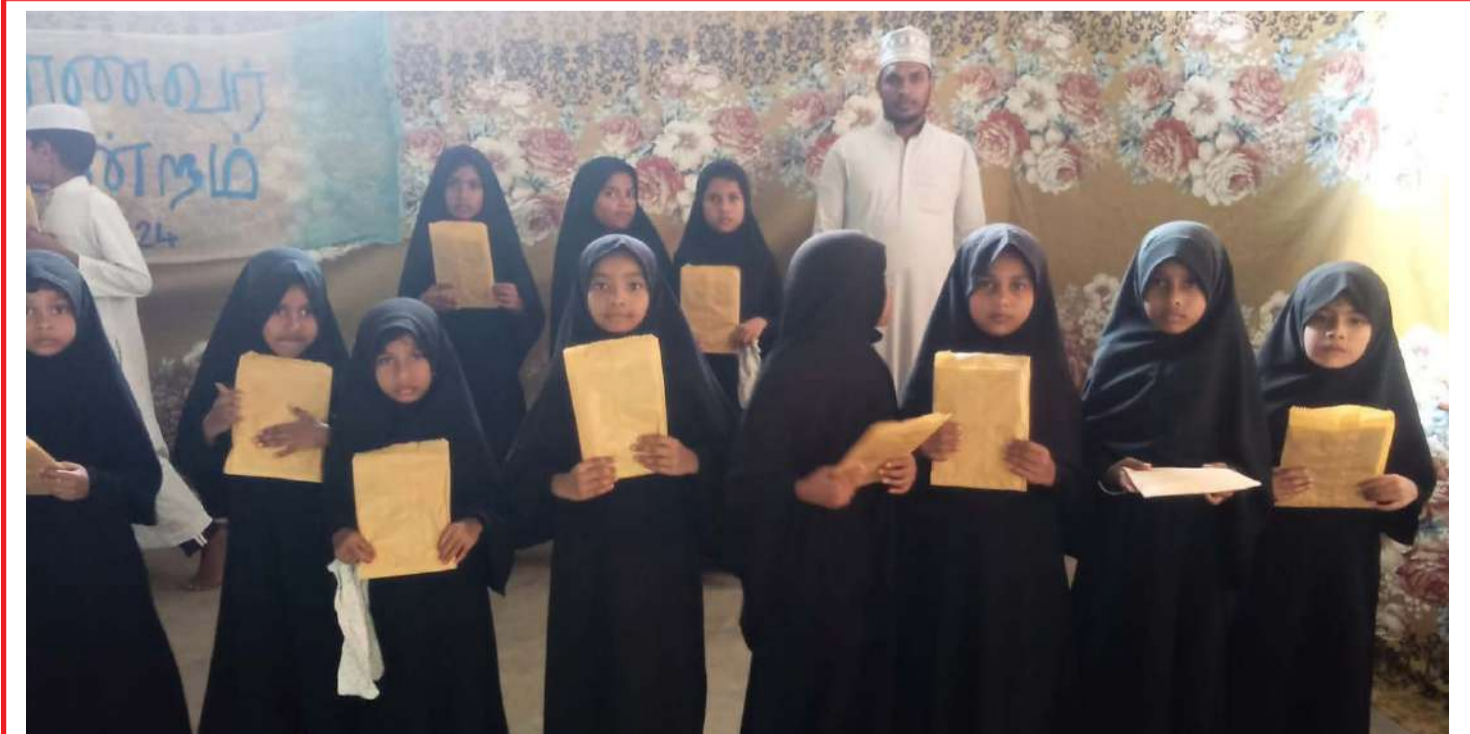
கொல்வந்தலுவ தக்கியா பள்ளி வாசலில் இயங்கி வரும் அல் மத்ரஸதில் தாரூல் உலூம் குர்ஆன் மத்ரஸா மாணவர்களின் மாணவர் மன்ற நிகழ்ச்சிகளும் பரிசளிப்பு நிகழ்வும் இடம்பெற்றது. யும்: ஏ.எம்.எம். இப்ராஹீம்

தேவையான வருமானத்தை தேடிக்கொள்வது கல்வியின் முக்கிய நோக்கங்களில் ஒன்றாகும். வாலிய வயதில் கல்வியைத்தவிர வேறு எந்த சிந்தனைக்கும் இடம்கொடுக்கக்கூடாது. அதேநேரம் சுயமாக தொழில் தொடக்கி பலருக்கு தொழில் வழங்குவதாக மாறும் கல்விமுறையில் நாம் எல்லோரும் கவனம் செலுத்த வேண்டும். அத்தோடு சமூக அக்கறை கொண்டவர்களாகவும் நாம் இருக்க வேண்டும். உங்களில் இருந்து நல்ல தலைவர்கள் உருவாகி நமது மக்களை நன்றாக வாழவைக்க கூடியவர்களாக மாறவேண்டும். இன்று நாம் நமது மக்கள் படுகின்ற துன்பங்களுக்கு மூல காரணம் சரியான தலைவர்களை நாம் உருவாக்க தவறியமைதான். ஆகவே அதிலும் நாம் கவனத்துடன் அக்கறை செலுத்த வேண்டும் என தெரிவித்தார்