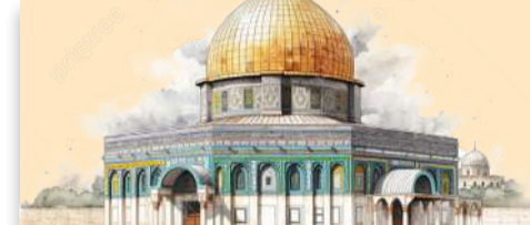
பிரபுவே, உங்கள் தினத்தில் எல்லா மனிதரும் மௌனமாய் உள்ளன

அதே போல தமிழ் சிங்கள இலக்கிய உறவின் வரலாறு மற்றும் போக்கு குறித்து மேற்படி நூல் மூலம் வாசித்து அறிந்து கொள்ளலாம்.