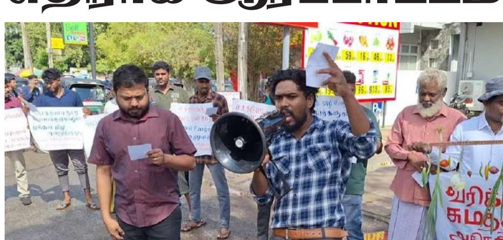
(தோட்டியர் - எஸ். ஏ. எம். அஸ்மி)

வடவரி அதிகரிப்புத் திட்டத்திற்கும், மரக்கறி உள்ளிட்ட அத்தியாவசிய பொருட்களின் விலை அதிகரிப்புக்கும் எதிர்ப்புத் தெரிவித்து மூதூர் பிரதான வீதியின் முன்பாக வியாழன்று (18) காலை ஆர்ப்பாட்டம் முன்னெடுக்கப்பட்டது. தேசிய மக்கள் சக்தியின் மூதூர் கிளை இதனை ஏற்பாடு செய்திருந்தது. இதன்போது நாட்டில் தற்போது மரக்கறிகளின் விலைகள் அதிகரிப்புச் செய்யப்பட்டதை வழியறுத்தும் வகையில் மரக்கறிகள் விழிப்புணர்வுக்காக காட்சிப்படுத்தப்பட்டிருந்தது.