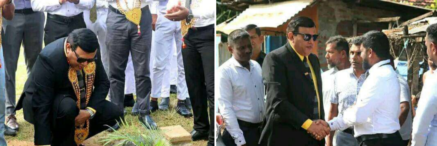
கல்வி இராஜாங்க அமைச்சர் எ.அரவிந்த் குமாரினால் கடந்த சனியன்று (30) மூதூர் ஆயிஷா வித்தியாலயத்திற்கான மூன்று மாடிகட்டிடத்திற்குரிய அடிக்கல் நாட்டி வைக்கப்பட்டது.

கடற்படையினர் தங்களது உயிர்களை துச்சமென மதித்து நீர் கசிவு தொடர்பில் ஆராய்ந்துள்ளனர். குளத்தின் நீரேந்து பகுதி பூட்டப்பட்டு நீர் கசிவு தொடர்பில் நீருக்கடியில் அதன் பாதக விளைவுகள் தொடர்பில் தொழில் நுட்ப ரீதியான விளைவுகளை கண்டு கொண்டனர் அதன் பின் சுமுகமாக குளத்தின் நீர் மட்டம் திறக்கப்பட்ட நிலையில் கசிவு ஏற்படாதவாறு சரி செய்யப்பட்டு குளத்து நீர் மீண்டும் பின்னர் திறக்கப்பட்டது.