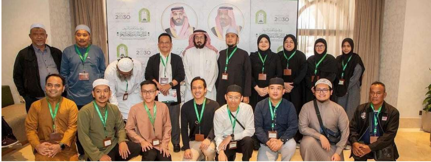
ஹஜ் உம்ரா மற்றும் புனித ஸ்தலங்களைத் தரிசிப்பதற்கான மன்னர் சல்மான் பின் அப்தில் அஸ