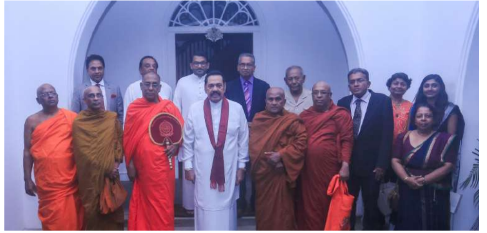
இலங்கை வந்துள்ள புலம்பெயர் தமிழ் அமைப்பின் பிரதிநிதிகள் முன்னால் ஜனாதிபதி மகிந்த ராஜபக்சவைச் சந்தித்த போது எடுக்கப்பட்ட படம்.